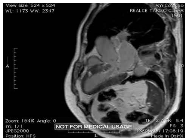
Figura 2: Distúrbio de condução intraventricular, aparecimento de bloqueio de ramo direito na evolução do caso.

As arritmias ventriculares são relacionadas ao envolvimento miocárdico pelos granulomas não caseosos e áreas de processo inflamatório em resolução que geralmente evoluem com a formação de cicatriz miocárdica, fornecendo o substrato para o mecanismo de reentrada. Extra-sístoles e taquicardias ventriculares monomórficas são mais frequentemente observadas, contudo, também podem ocorrer arritmias polimórficas. Já as arritmias supraventriculares (extrasístoles, flutter e fibrilação) são mais comumente consequências da