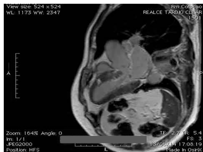
Figura 2: Distúrbio de condução intraventricular, aparecimento de bloqueio de ramo direito na evolução do caso.

As arritmias ventriculares são relacionadas ao envolvimento miocárdico pelos granulomas não caseosos e áreas de processo inflamatório em resolução que geralmente evoluem com a formação de cicatriz miocárdica, fornecendo o substrato para o mecanismo de reentrada. Extra-sístoles e taquicardias ventriculares monomórficas são mais frequentemente observadas, contudo, também podem ocorrer arritmias polimórficas. Já as arritmias supraventriculares (extrasístoles, flutter e fibrilação) são mais comumente consequências da